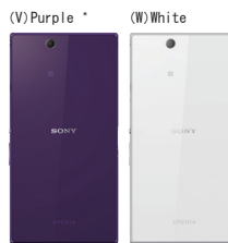
*ソニーストア限定

(V) Purple は全国のFVAIOオーナーメードモデル展示店、「e-ソニーショップ」、「ソニーのインターネット直販サイト ソニーストア」でご注文いただけます。